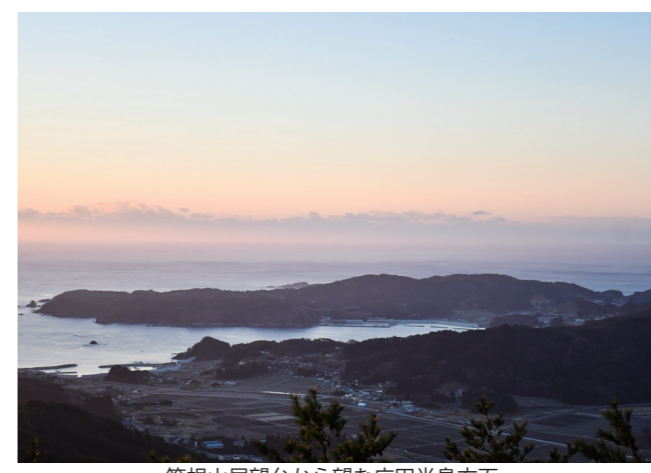
箱根山展望台から望む広田半島方面

みちのく潮風トレイルは、青森県八戸市蕪島から福島県相馬市松川浦までの4県28市町村の海岸線を中心に設定された全長千キロを超えるロングトレイルです。トレイルのルートは地元の人からの意見を通じて設定され、6月9日に全線が開通し、「1本の道」となりました。今後、適切な維持管理や情報発信など、みちのく潮風トレイルを皆さまに楽しく安全に歩いていただくための取り組みを進めてまいります。